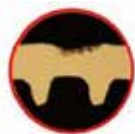
Serpentins en cuivre ProCore™

PROCORE™ High Corrosion-Resistant Technology